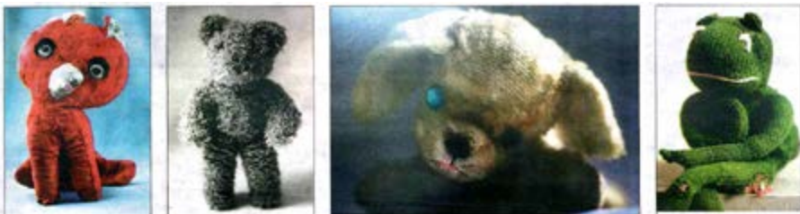
Raplécé, borque, molilé, mais tellement câlin. Portraits de doudous plus vrais que nature à la médiathèque d'Angoulême. Tirés de la collection du musée national de l'Éducation.